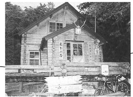
木下小屋 (羅臼岳山小屋)

営業期間…6月下旬～9月下旬 宿泊定員…40名程 宿泊料金…素泊り2,500円 休憩のみ…300円 駐車場…乗用車のみ数台程度 宿泊予約はTEL: 0152-24-2824