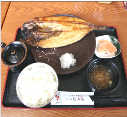
焼き魚定食 (ほっけ)