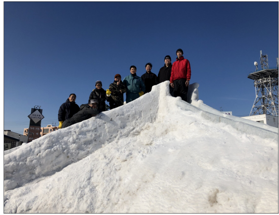
道の駅に滑り台、氷柱を作成しました