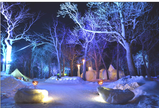
ライトアップされた会場の様子

昨年からは始まったイベントだが、平日に300人、土日には倍の400人以上の人を呼び込むイベントとなった。今年も知床野営場で行われ、盛り上がりを見せていたようだ。氷で造形されたアイスタワーや飲食のアイスバーなど知床の自然を生かした夜のイベントは、辺りがライトアップされており普段では味わえない幻想的な空気に包まれていた。暖かいアルコールドリンクや、焚き火コーナーの設置など寒さ対策もばっちりである。会場の中ではハンモックを使った星空観賞や空中テント、ネイ