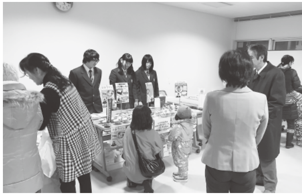
恒例となった高校生のスイーツ販売

去る12月9日(金)17時～20時30分、道の駅しやり特設会場において「知つとこ特産品フェア」が開催されました。 本年度8回目を数える催しは斜里町の特産品を多くの町民に知ってもらうことを目的とし、生産者・出展者による特産品の商品説明や試食販売を通して来場者に斜里町の「特産品の良さ」や「魅力」を再発見・再認識してもらい、地元での「消費拡大」と町内外に向けての「ギフト」などへの活用に向けた企画でもあります。 今回は「知床しやりブランド」認