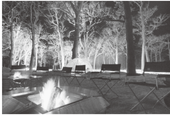
「グリーンステージ」の様子

昨年度で終了した冬のイベント「知床オーロラファンタジア」に代わり、本年新たなイベントが知床流水フェス実行委員会の主導で開催されます。 名称は「知床流水フェス」。2会場に分けて行うイベントの内容を紹介します。まず知床国設野営場で行う「グリーンステージ」では水のアートやたき火空間の提供、星空観察、流水のライトアップなどがあり、冬の大自然が創り出す幻想的な空間に、氷と雪のアートが調和した新たな世界を提供します。「グリーンステージ」は有料で一人500円です(トコさんバッチ・ドリンク付き)。オ