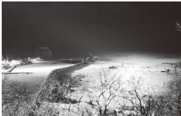
ライトアップされたウトロ港(グリーンステージ)

昨年度で終了した冬のイベント「知床オーロラファンタジア」に代わり、本年新たなイベントが知床流水フェス実行委員会の主導で開催されます。 名称は「知床流水フェス」。2会場に分けて行うイベントの内容を紹介します。まず知床国設野営場で行う「グリーンステージ」では水のアートやたき火空間の提供、星空観察、流水のライトアップなどがあり、冬の大自然が創り出す幻想的な空間に、氷と雪のアートが調和した新たな世界を提供します。「グリーンステージ」は有料で一人500円です(トコさんバッチ・ドリンク付き)。オ