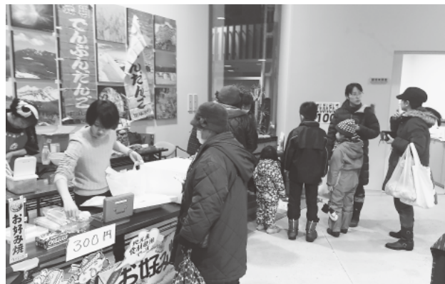
女性部によるお好み焼き販売

去る12月9日(金)17時～20時30分、道の駅しやり特設会場において「知つとこ特産品フェア」が開催されました。 本年度8回目を数える催しは斜里町の特産品を多くの町民に知ってもらうことを目的とし、生産者・出展者による特産品の商品説明や試食販売を通して来場者に斜里町の「特産品の良さ」や「魅力」を再発見・再認識してもらい、地元での「消費拡大」と町内外に向けての「ギフト」などへの活用に向けた企画でもあります。 今回は「知床しやりブランド」認