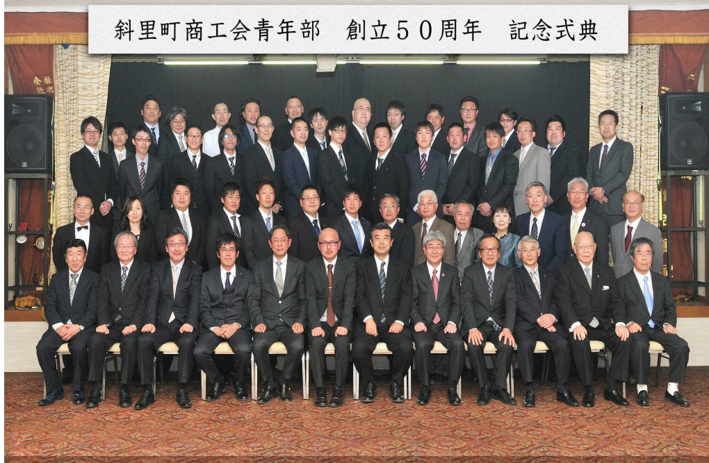
斜里町商工会青年部 創立50周年 記念式典