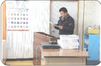
受講生を前に挨拶する上野工業副部長