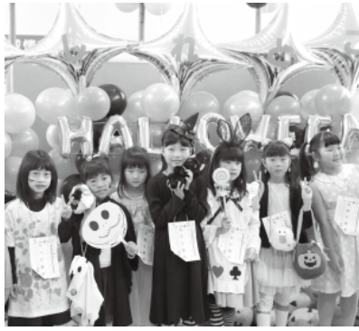
バラエティ豊かな衣装に身を包み、仮装を楽しむ子どもたち

10月19日、第4回「しれとこハロウィン2019」が実行委員会のもとで開催されました。当日は町内各所で他のイベントなどが多く開催されているなかでしたが、会場の道の駅しやりには、大勢の子どもたちが集まり、かわいらしく仮装して、賑わいを見せていました。